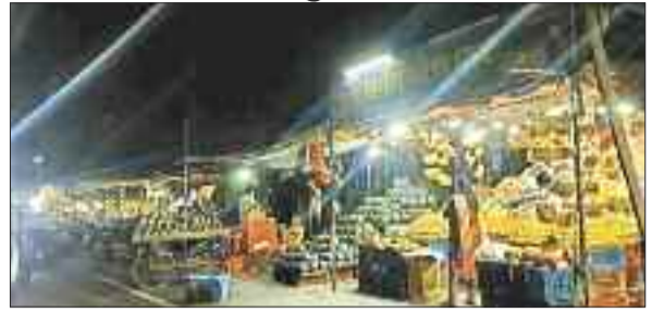
फिर से शुरू हुआ अतिक्रमण।