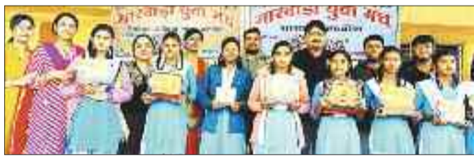
पुरस्कार प्राप्त करती छात्राएं।