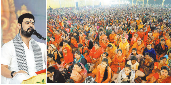
कथावाचक व कथा सुनते श्रद्धालु।