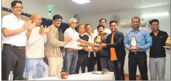
अंतर क्षेत्रीय शतरंज प्रतियोगिता के विजेताओं को पुरस्कृत अतिथि।

छत्तीसगढ़ स्टेट पाँवर कंपनी के अंतर क्षेत्रीय शतरंज प्रतियोगिता में महिला वर्ग से कोरबा वेस्ट टीम