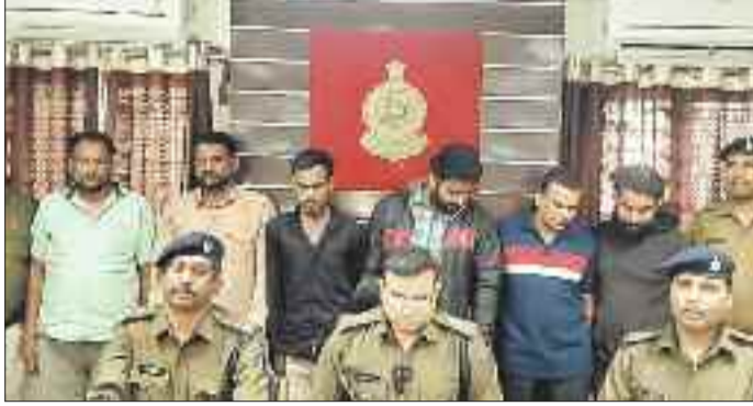
पुलिस गिरफ्त में आरोपी व मीडिया से चर्चा करते अफसर।

जिले में अक्सर मोटरसाइकिल की चोरी की घटना सामने आई थी। पिछले कुछ दिनों से जिले के अलग-अलग क्षेत्र से मोटरसाइकिल के साथ-साथ ट्रेलर वाहन