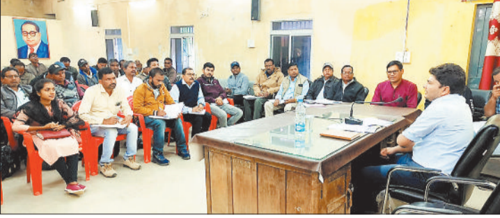
अधिकारी कर्मचारियों की बैठक लेते सीईओ।