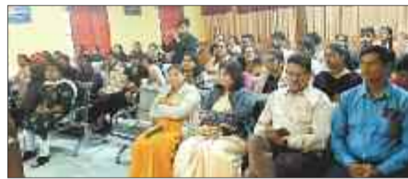
कार्यक्रम में उपस्थित प्रोफेसर व छात्र छात्राएं।

विश्व ऊर्जा संरक्षण दिवस पर शासकीय ईवीपीजी कॉलेज में कार्यक्रम का आयोजन किया गया। पीजी कॉलेज के रसायन विभाग