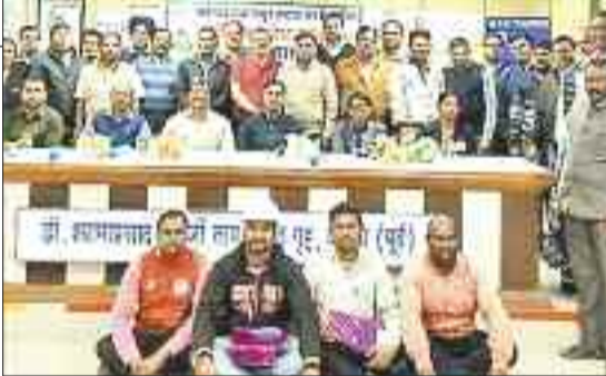
सुरक्षा सप्ताह के दौरान डीएसपीएम के अधिकारी व कर्मचारी।